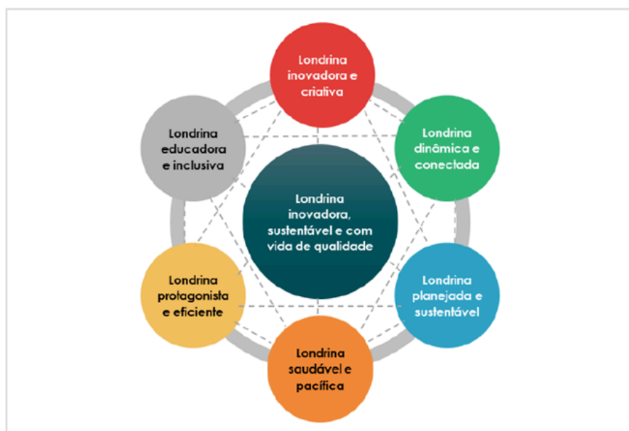
Figura 3. Áreas de Resultado

Segundo o DataSUS, a taxa de homicídios de Londrina caiu 38,5% na década, com o número de homicídios passando de 140 em 2009 para 96 em 2019. Com 16,8 homicídios a cada 100 mil hab. em 2019, Londrina teve taxa foi inferior à média da região metropolitana e do estado, porém superior a de Ribeirão Preto, Uberlândia e Joinville. Quando comparado aos 100 maiores municípios brasileiros, o município ocupou a 46ª menor taxa de homicídios em 2019.