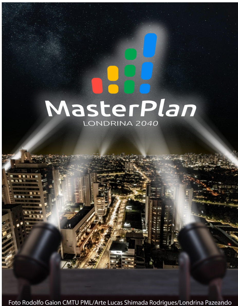
Foto Rodolfo Gaion CMTU PML/Arte Lucas Shimada Rodrigues/Londrina Pazeando